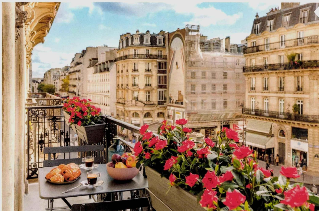
La Suite du Roi dispose d'une petite terrasse avec vue sur les rues de Paris.

ooo demande croissante de locations courte durée souvent liées à des événements majeurs tels la Fashion Week, les grands salons ou les Jeux olympiques. Parmi ses pépites, un appartement de trois chambres situé rue de Rivoli, face au Louvre avec parquet, cheminée, moulures, et une incroyable salle de bains (avec hammam) entièrement parée de marbre. Tout y est : des éléments décoratifs haussmanniens, des meubles sur mesure et des œuvres d'art, le tout sous des plafonds de plus de 4 mètres de hauteur », précise l'enquête.